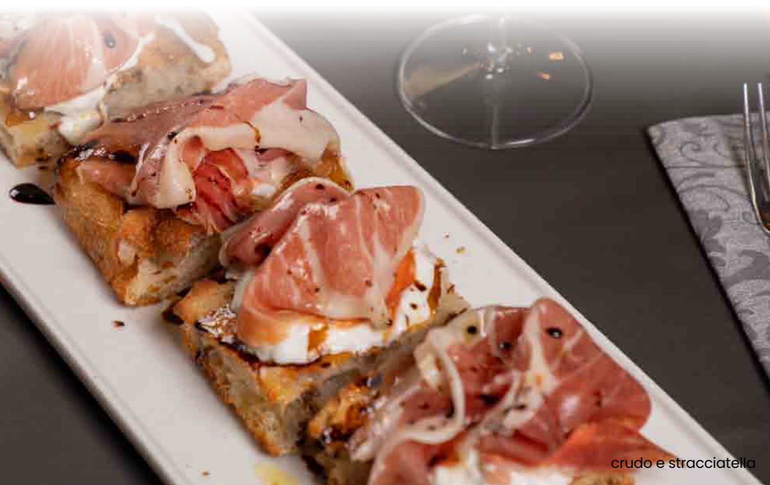
crudo e stracciatella

FARINE: Tipo 0 e Tipo 2 bio macinate a pietra